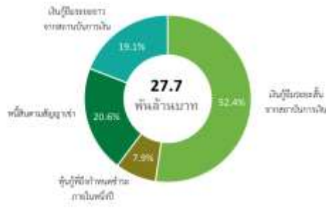
ต้นทุนทางการเงิน